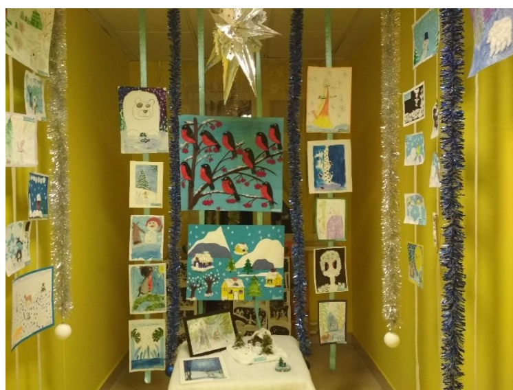
Выставка детских рисунков «Зимняя сказка»