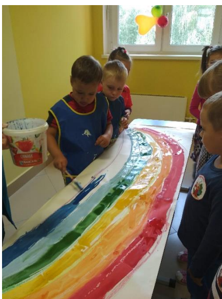
Реализация проекта «Веселый художник»

В рамках художественно-эстетического развития дошкольников реализованы проекты «Волшебная кладовая», «Музыкальная шкатулка», «Веселый художник». Особое внимание уделяем анализу детских работ с целью повышения качества обучения рисованию в детском саду, выявлению умений и навыков в рисовании как отдельных предметов, так и несложных сюжетных композиций, уровня техники изображений, развития цветового восприятия, диагностике детей старшего дошкольного возраста; динамичному наблюдению за результатами художественной деятельности детей. В зависимости от результатов анализа мы корректируем индивидуальную работу с детьми.